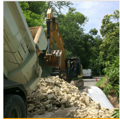
Travaux de réfection de voirie

Ces travaux de voirie sont pris en charge par la communauté de communes Aveyron Bas Ségala Viaur.