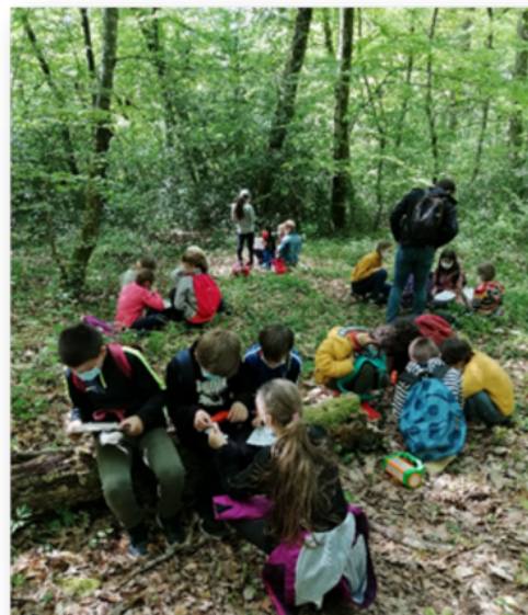
l'école de Solville au bois du Bruel

Ce projet prend forme grâce à l'implication de nos habitants et des élèves de l'école ainsi que de leur équipe pédagogique. Les enfants ont pu bénéficier malgré les difficultés dues au confinement d'une visite avec l'animatrice du CPIE du site au printemps.