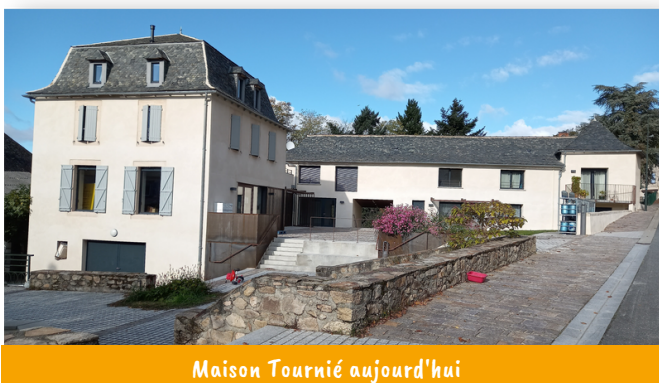
Maison Tournié aujourd'hui

A la place de l'ancien bar, l'épicerie a pris sa place et est opérationnelle depuis le mois d'octobre. Le bar, lui, ouvre courant décembre.