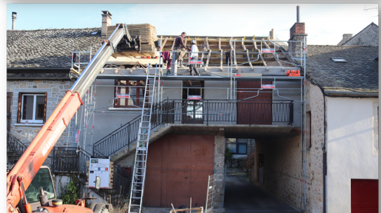
Mise en place de la charpente par l'entreprise Thierry Vabre de Lunac