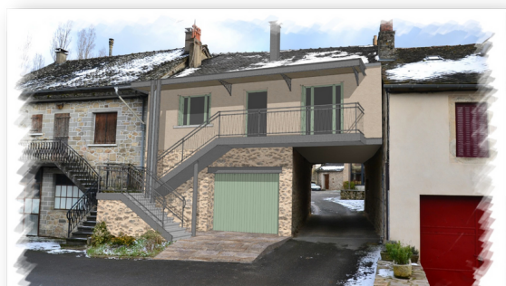
Esquisse de la Maison Lacombe rénovée

Ce chantier devrait être terminé fin juin 2022.