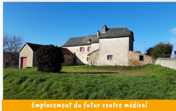
Emplacement du futur centre médical