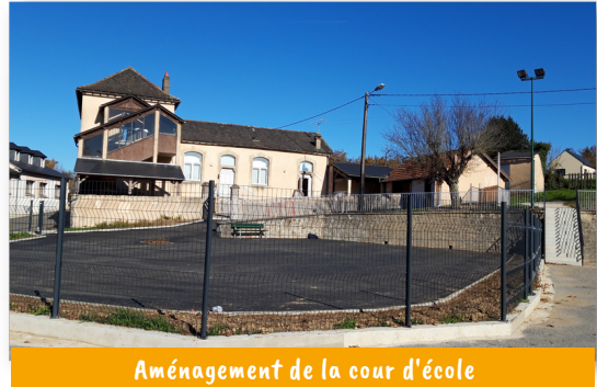
Aménagement de la cour d'école