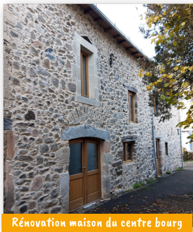
Rénovation maison du centre bourg

Pour accueillir de nouvelles familles dans le but de renforcer l'effectif de nos écoles et faire vivre notre territoire, la commune du Bas Ségala s'inscrit dans une démarche de développement du parc immobilier. Au niveau de la commune déléguée de La Bastide l'Évêque cela se traduit par de nombreuses initiatives.