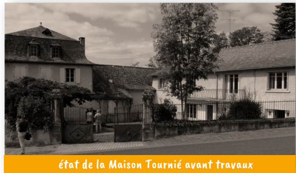
état de la Maison Tournié avant travaux

Petit à petit, l'idée d'aménager des logements en locatif et de créer un commerce multiservices faisait son chemin. Mais fallait-il pour cela trouver des financements.