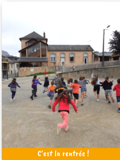
C'est la rentrée !