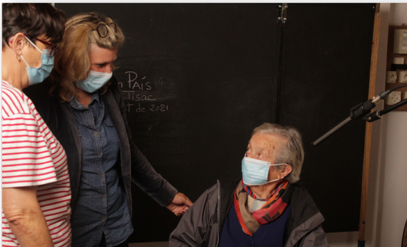
collectage occitan durant l'opération país

Avec le projet PAÍS, l'Institut Occitan de l'Aveyron (IOA), service associé du Conseil départemental dédié au patrimoine immatériel occitan, effectue une opération de valorisation des territoires aveyronnais par la mise en relief de leurs singularités au travers d'un collectage occitan dans chaque commune.