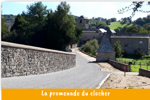
La promenade du clocher

La cour est clôturée conformément à la demande de l'Education nationale pour des raisons de sécurité. Des arbres et une haie d'arbustes viendront agrémenter la cour et y apporter de l'ombre et de la fraîcheur. Le revêtement de la cour a été entièrement refait. Un chemin permet aux piétons de contourner la cour de l'école pour accéder de la salle des fêtes au centre du bourg.