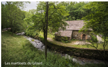
Les martinets du Lézert

Dans la commune du Bas Ségala, ce circuit permet de relier les villages de La Bastide l'Evêque, Saint-Salvadou et Vabre-Tizac et de profiter de paysages typiques du Ségala entre les ruisseaux du Lézert et des Serènes. Parcourir ce chemin c'est profiter d'une nature préservée et se ressourcer en pleine nature !